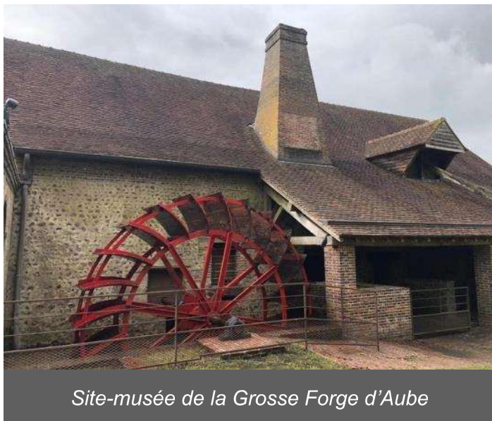
Site-musée de la Grosse Forge d'Aube

Contact secrétariat des musées : Mme Bienne secretariat2museesaube61@orange.fr ; tél 02 33 24 60 09