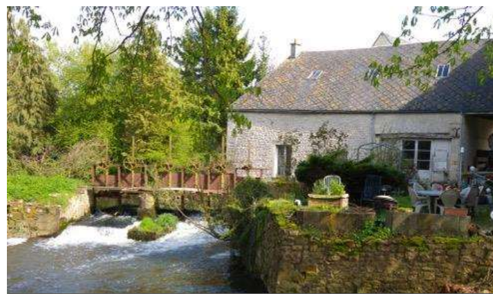
Le moulin aux Violettes à Ecouché les Vallées (61)

*Le moulin de Boiscorde , Rémalard en Perche (61 110)