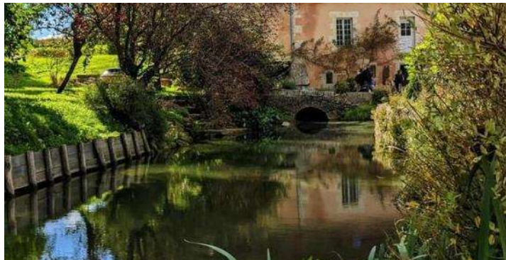
Le moulin de Radray, nature et patrimoine pour redonner vie au moulin et à son four à pain

*Le moulin du Chêne , La Perrière (61 360)