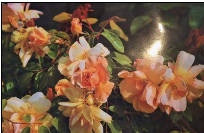
La rose « Moulin de Gouville », de Christian Hanak, obtenteur de roses

*Moulin de la Feuillie (50190) Visite guidée de l'église, du plan d'eau avec jeux pour enfants, du moulin à eau. Exposition-photos présentant la faune et la flore.