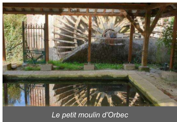
Le petit moulin d'Orbec

Visite découverte : la rivière l'Orbiquet, le lavoir, le petit moulin d'Orbec et sa roue en mouvement, la machine à