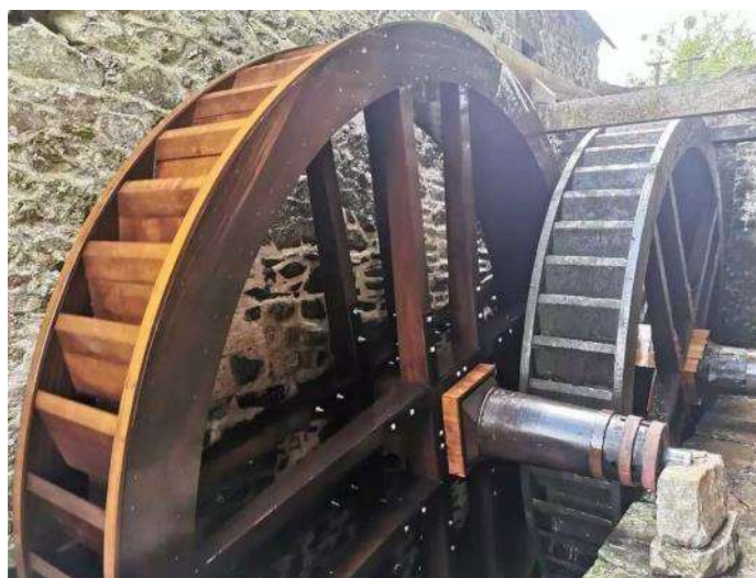
Moulin Haut de Bellefontaine (Grosville 50)

Situé sur la Dielette à Grosville, nord-ouest Cotentin, il sera aussi beau qu'en 1726, puisqu'il a retrouvé la splendeur de sa jeunesse avec sa nouvelle couverture en schistes. Il date du 18ème et n'a pas été modifié depuis. Il a conservé l'intégralité de ses mécanismes totalement en bois. 3 couples de meules sont entraînés par 2 roues en bois. Un groupe de Bénévoles se dépense sans compter depuis des années pour restaurer le bâtiment et les mécanismes dans leur état d'origine. Ce sera alors le seul moulin du Nord Cotentin parvenu jusqu'à nous, tel qu'il fonctionnait au 18ème siècle.