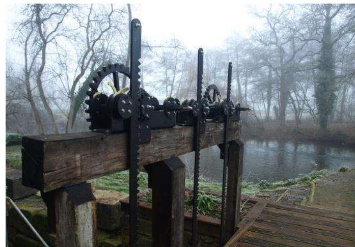
Vannage moulin de Rimou

Visite gratuite le samedi 22 juin entre 10H00 et 18H00.