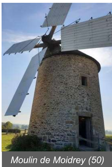
Moulin de Moidrey (50)

Contact : chris.gilb@free.fr ou hvs.100m@gmail.com