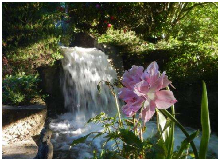
Le Moulin de Boiscorde, lieu apaisant et insolite

Nature de l'évènement : brève description ou tout autre information susceptible d'intéresser les visiteurs.