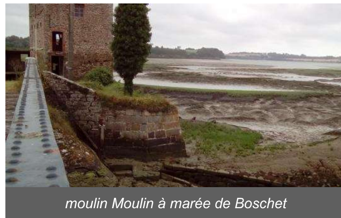
moulin Moulin à marée de Boschet

Contact : "les Amis des Moulins de Rance"