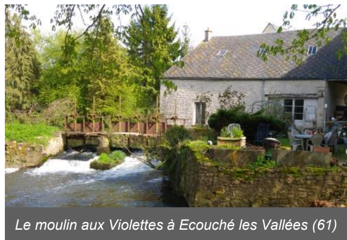
Le moulin aux Violettes à Ecouché les Vallées (61)

*Le moulin de Boiscorde , Rémalard en Perche (61 110)