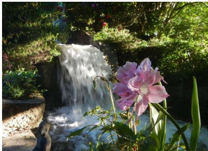
Le Moulin de Boiscorde, lieu apaisant et insolite

Nature de l'évènement : brève description ou tout autre information susceptible d'intéresser les visiteurs.