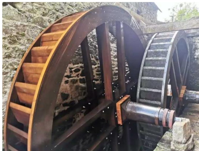
Moulin Haut de Bellefontaine (Grosville 50)

Situé sur la Dielette à Grosville, nord-ouest Cotentin, il sera aussi beau qu'en 1726, puisqu'il a retrouvé la splendeur de sa jeunesse avec sa nouvelle couverture en schistes. Il date du 18ème et n'a pas été modifié depuis. Il a conservé l'intégralité de ses mécanismes totalement en bois. 3 couples de meules sont entraînés par 2 roues en bois. Un groupe de Bénévoles se dépense sans compter depuis des années pour restaurer le bâtiment et les mécanismes dans leur état d'origine. Ce sera alors le seul moulin du Nord Cotentin parvenu jusqu'à nous, tel qu'il fonctionnait au 18ème siècle.