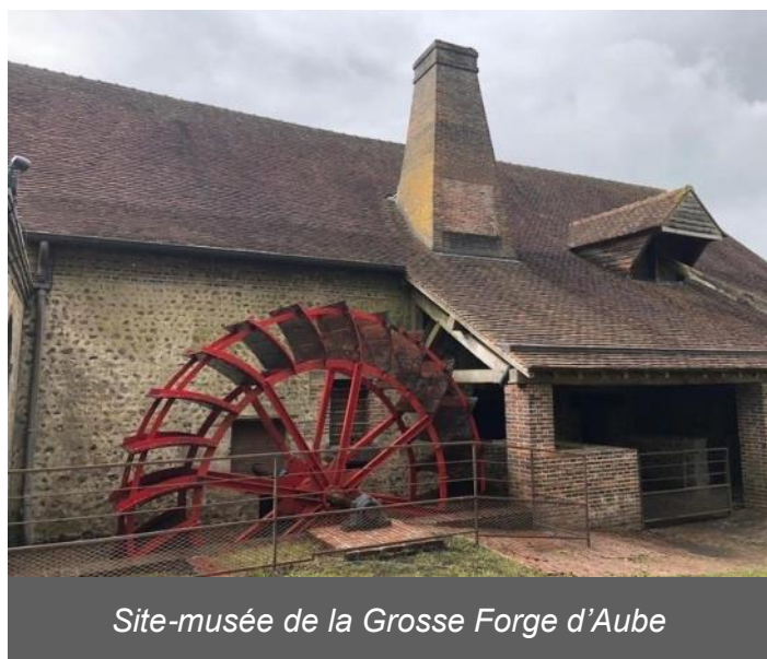
Site-musée de la Grosse Forge d'Aube

secretariat2museesaube61@orange.fr ; tél 02 33 24 60 09