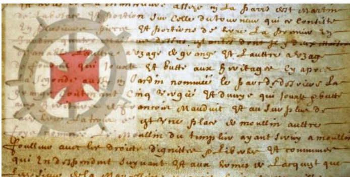
moulin de Templiers à la Flagère

*Moulin de la Flagère Souleuvre-en-Bocage (14350)