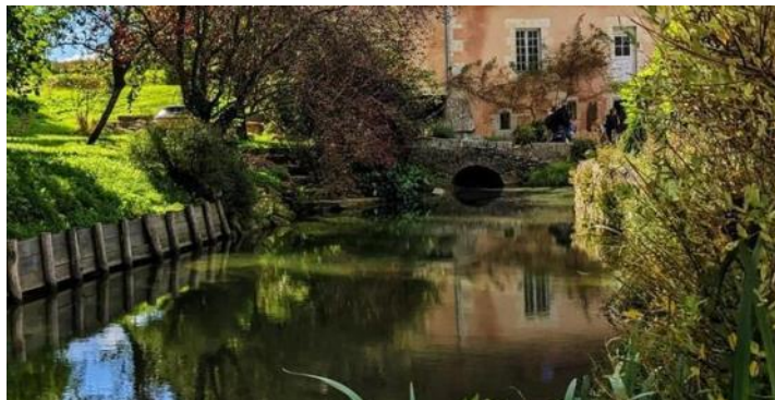
Le moulin de Radray, nature et patrimoine pour redonner vie au moulin et à son four à pain

*Le moulin du Chêne , La Perrière (61 360)