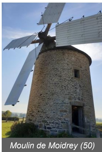
Moulin de Moidrey (50)

Contact : chris.gilb@free.fr ou hvs.100m@gmail.com