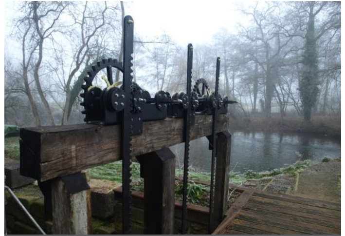
Vannage moulin de Rimou

Visite gratuite le samedi 22 juin entre 10H00 et 18H00.