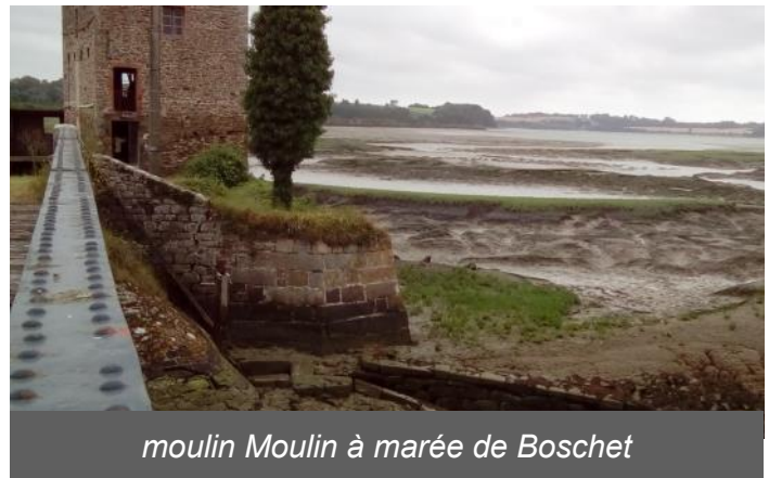
moulin Moulin à marée de Boschet

Contact : "les Amis des Moulins de Rance"