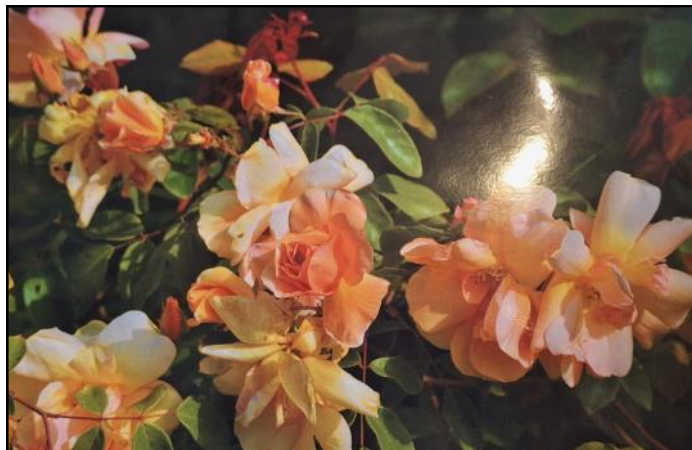
La rose « Moulin de Gouville », de Christian Hanak, obtenteur de roses

*Moulin de la Feuillie (50190) Visite guidée de l'église, du plan d'eau avec jeux pour enfants, du moulin à eau. Exposition-photos présentant la faune et la flore.