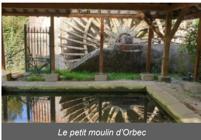
Le petit moulin d'Orbec

Visite découverte : la rivière l'Orbiquet, le lavoir, le petit moulin d'Orbec et sa roue en mouvement, la machine à