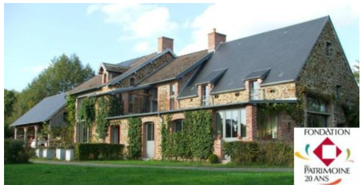
moulin de Pontécoulant après travaux

Ces expériences furent toutes plus sympathiques les unes que les autres. Je vous invite et vous encourage vivement à participer à ces journées qui font vivre notre patrimoine et contribuent à consolider l'attache-