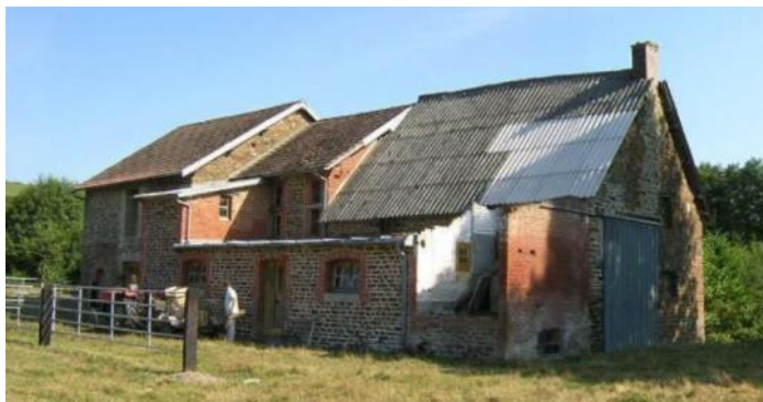
moulin de Pontécoulant avant travaux

Nous avons, mon père et moi, débuté la restauration du moulin en 2005, chaque mois de juin, ces journées avaient un air de réunions de chantier : nous rangions les outils, passions un grand coup de balai, expliquions quel était l'état d'avancement et en quoi consistaient les projets à suivre.